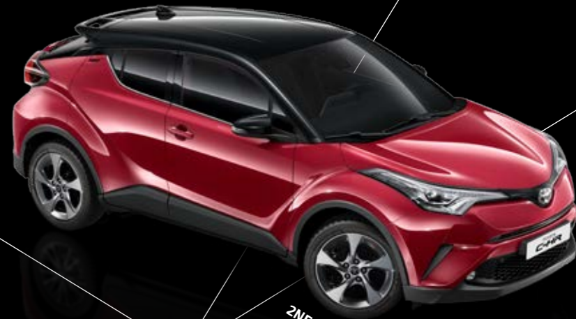
2NF Красный с черной крышей