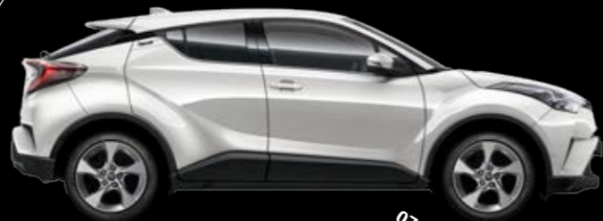
070 Белый жемчуг