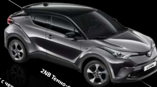
2NB Темно-серый с черной крышей*