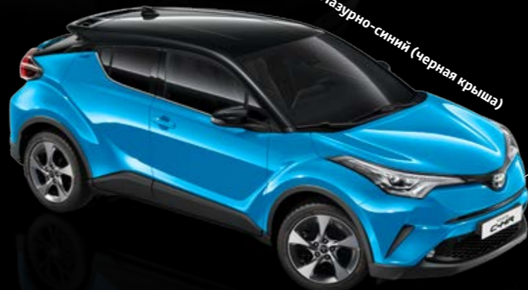
2RV Лазурно-синий (черная крыша)