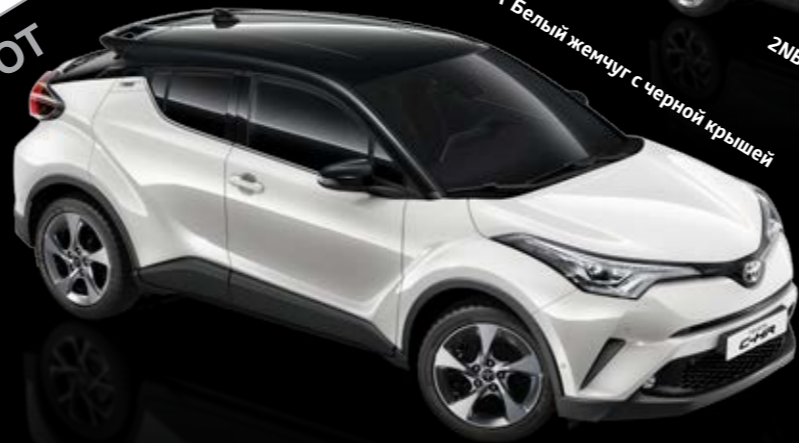
2NA Белый жемчуг с черной крышей