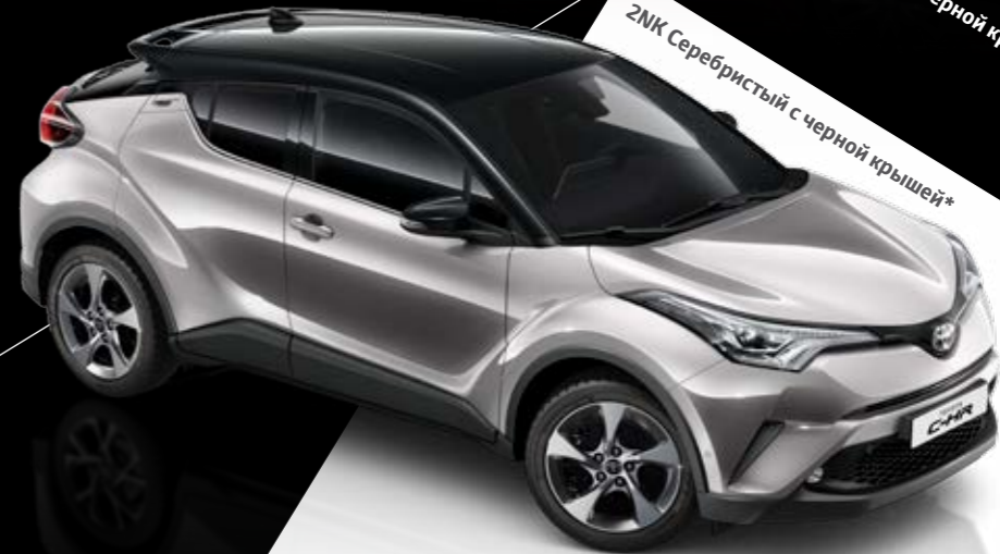
2NK Серебристый с черной крышей*