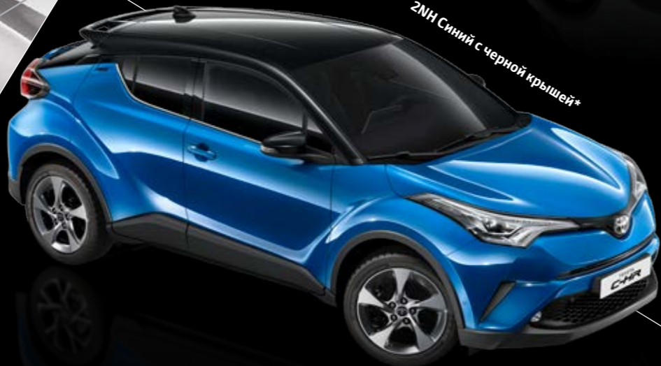
2NH Синий с черной крышей*