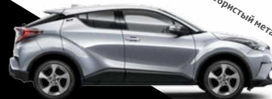
1F7 Серебристый металлик*